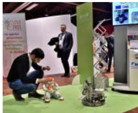
Hier aux Rev3days. La robotique, nouvelle filière en région.

plus « écolos ». C'est concevoir le futur grand parc tertiaire Aéropace près de l'aéroport de Lille-Lesquin avec le souci de l'économie de la ressource. Ou monter une vraie filière sur la méthanisation (en construisant nous-mêmes nos machines à produire du méthane). Ou devenir le leader national du biogaz injecté, construire une filière complète sur l'hydrogène et son stockage. Hors Rev3, ajouter le recyclage des métaux stratégiques ou des minéraux, la filière solaire... ■ Y. B.